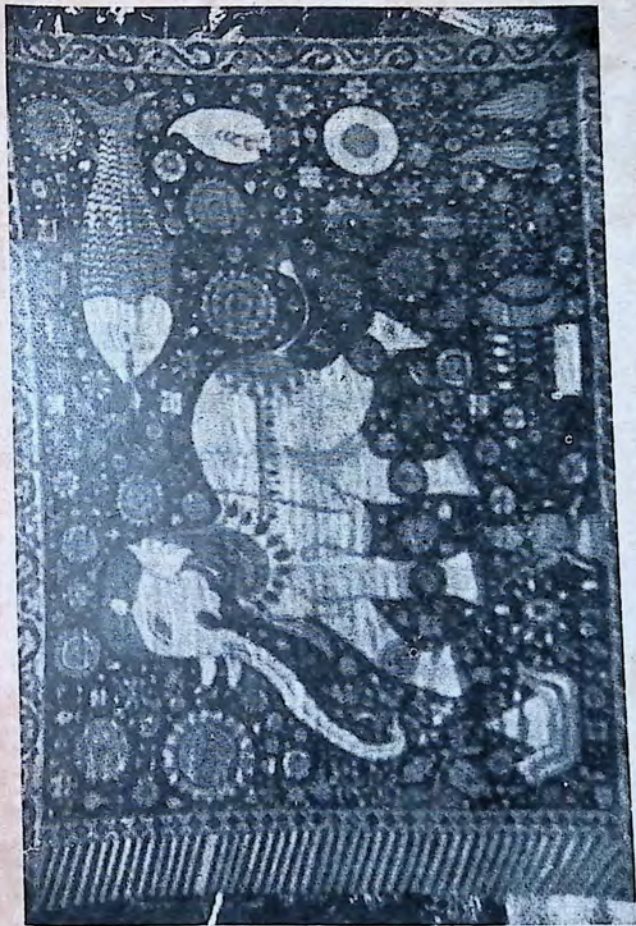
කුරුකුල රංචනාක්‍රමය (දිද්දෙනිය - සන්තෝරලේ.)