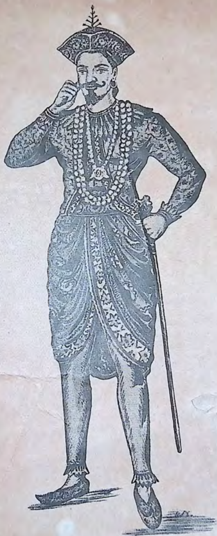
අන්තෝගි බැඳිත්තු කුලසුරිය උඩරට සුම රජතුමා.